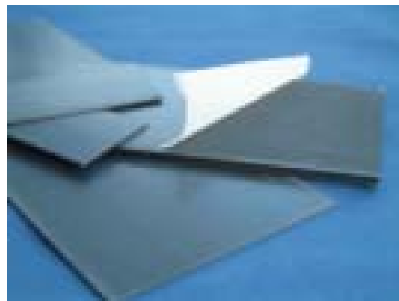
Bild 2. Pultruderad kolfiberremsa. (ovan) Applicerings av pultruderade kolfiberremсор. (nedan)