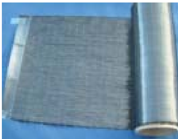
Bild 3. Ensriktad kolfiberväv.