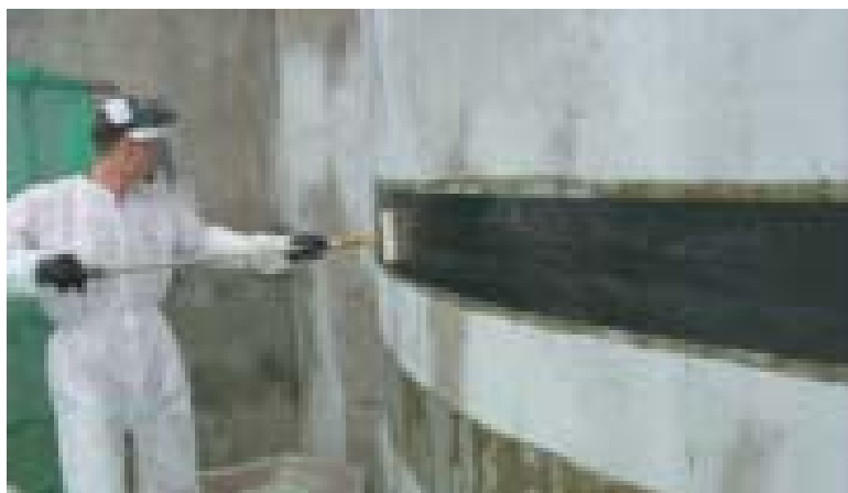
Bild 4. Handuppläggning av kolfiberväv.

► som kan variera från platta remsor och enkla rektangulära stavar till mer komplicerade sektioner som t.ex. I-balkar. Den prefabricerade kompositprofilen limmas därefter fast mot konstruktionen.