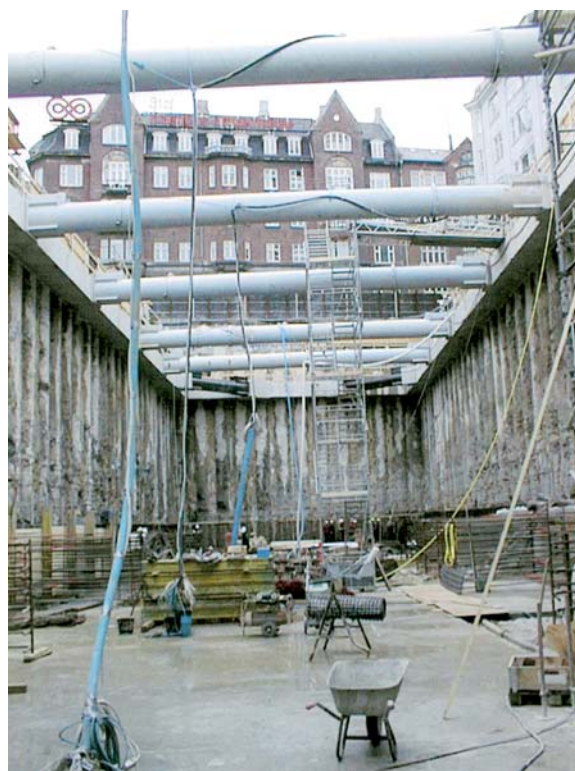
Figur 2. Konstruktionerna för de underjordiska Metrostationerna i centrala Köpenhamn baserades på ENV 1997-1 (1994). Här schakt för station Christianshavn.

Vid analys av EN 1997-1 finner man att den innehåller en stor mängd allmänt formulerade principer, som utgör krav, samt ett stort antal tillämpningsregler, som kan användas för att uppfylla kraven. Man saknar dock precisa föreskrifter och allmänna råd som i t ex BKR. Detta beror till stor del på att EN 1997-1 är resultatet av ett kompromissande mellan i första hand 18 länder med olika bakgrunder vad gäller byggregler, geologi, undersökningsmetoder, utvärderings- och dimensioneringsmetoder. Sett mot denna bakgrund är det dock enastående att man kommit