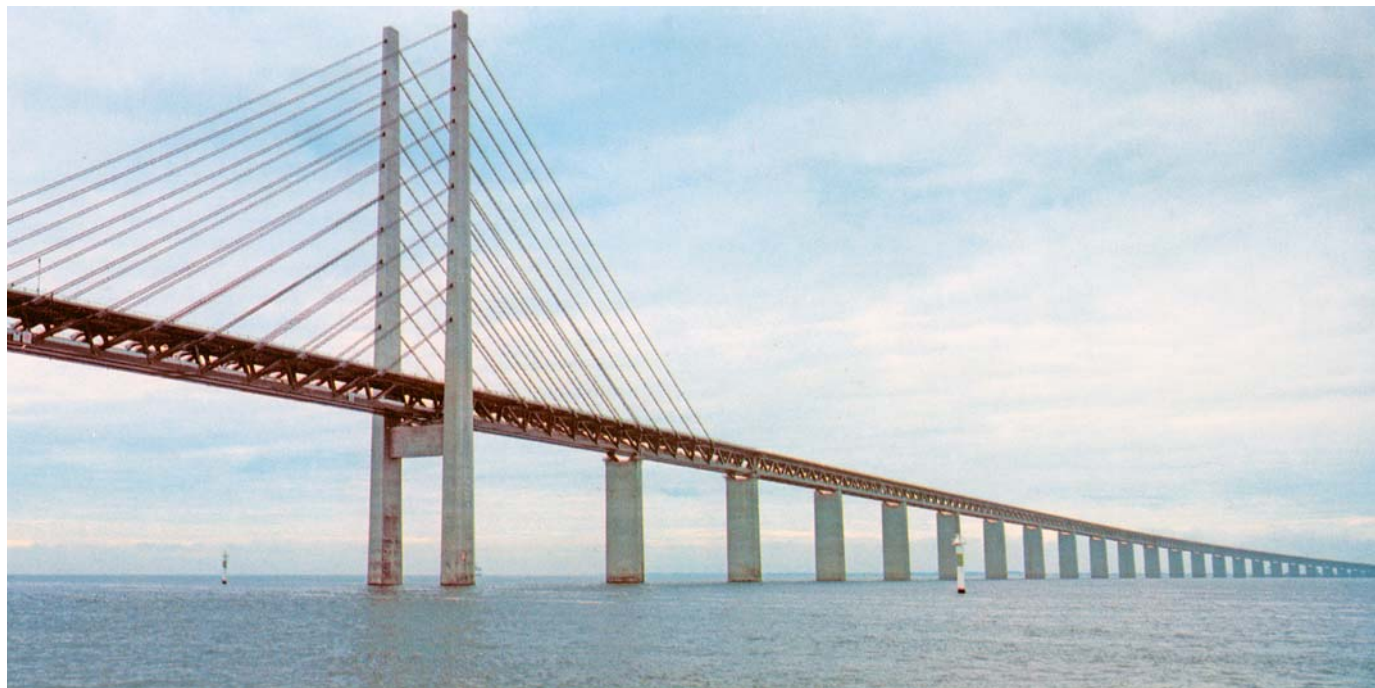
Figur 1. ENV 1997-1 (1994) användes som norm för grundläggningsarbetena för Öresundsförbindelsen.